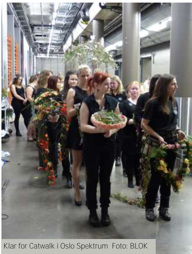
Klar for Catwalk i Oslo Spektrum

BLOK deltok på både Utdanningstorget på Lillestrøm og Yrkes og utdanningsmessa i Oslo Spektrum, der vi fikk snakket med både elever og foreldre om utdanningsmuligheter for de som ønsker å bli blomsterdekoratør.