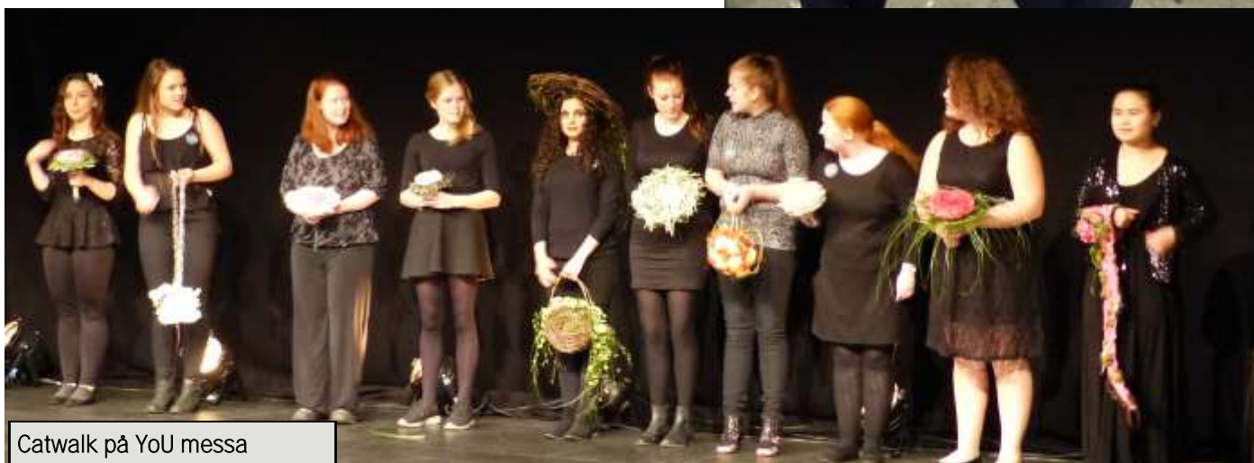
Catwalk på YoU messa 2015