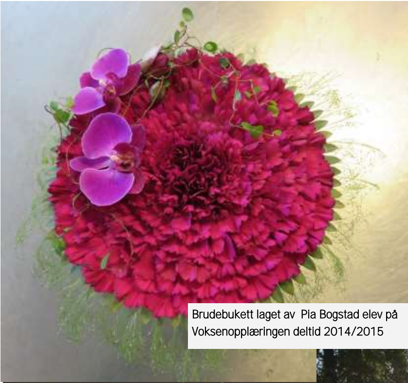
Brudebukett laget av Pia Bogstad elev på Voksenopplæringen deltid 2014/2015