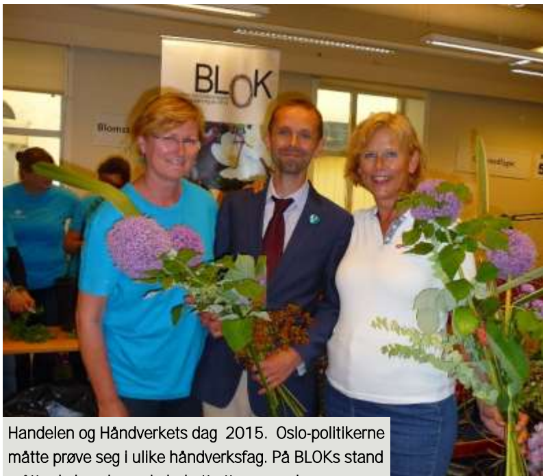
Handelen og Håndverkets dag 2015. Oslo-politikerne måtte prøve seg i ulike håndverksfag. På BLOKs stand måtte de lage hver sin bukett etter en mal.