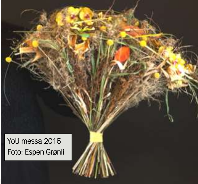
YoU messa 2015