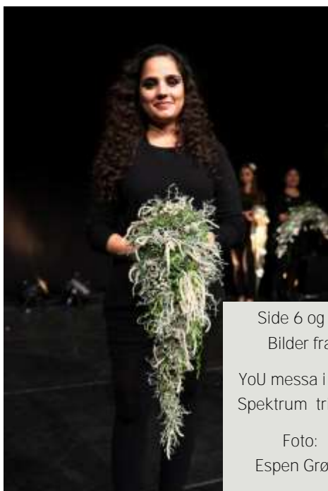
Side 6 og 7: Bilder fra YoU messa i Oslo Spektrum trinn 2