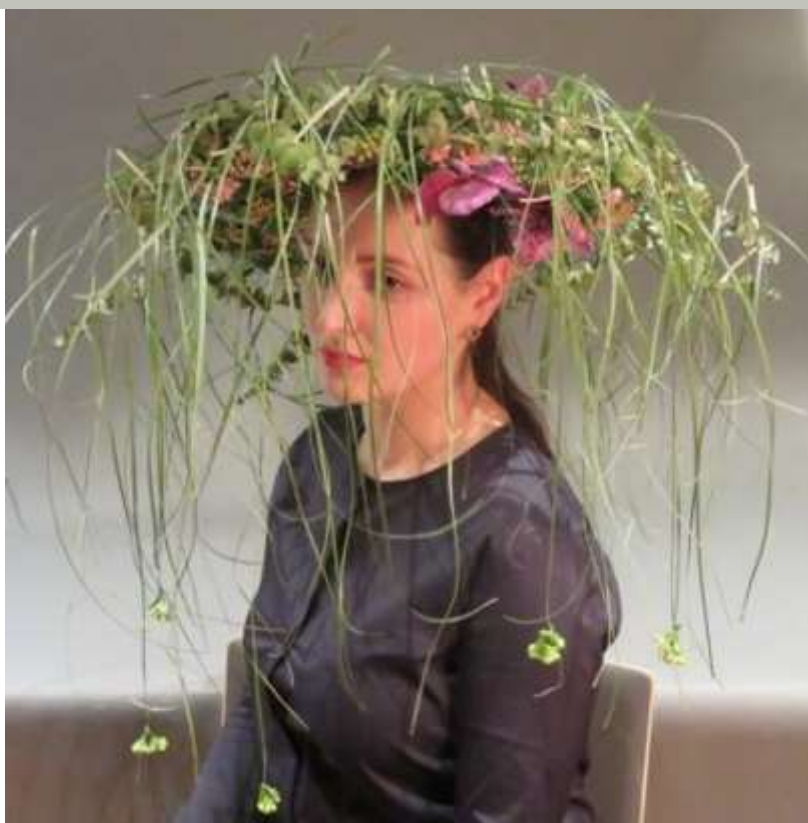
Inspirasjonstreff 2015 på BLOK Skøyen