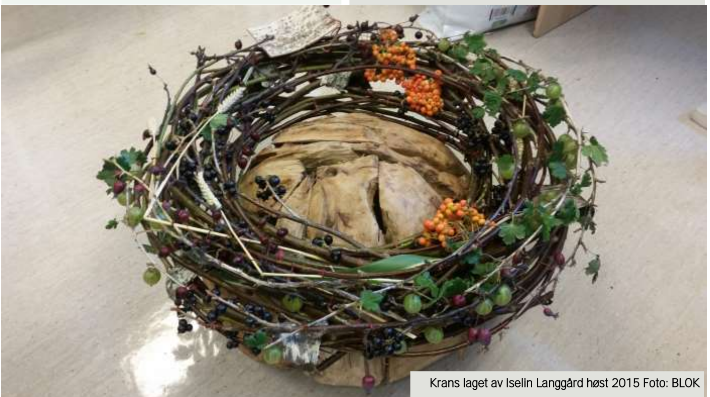
Krans laget av Iselin Langgård høst 2015

BLOK Hordaland: Renate Mæland Alvheim (Blomstermiljø), vara: Iselin Bruvik Vedaa (Ingvilds Blomsteratelier)