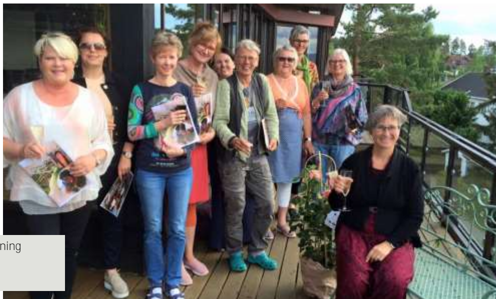
Sommeravslutning for de ansatte