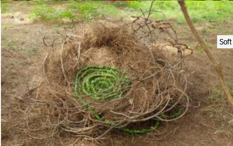
Soft Landart vår 2015