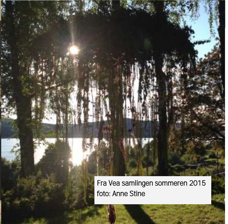
Fra Vea samlingen sommeren 2015 foto: Anne Stine