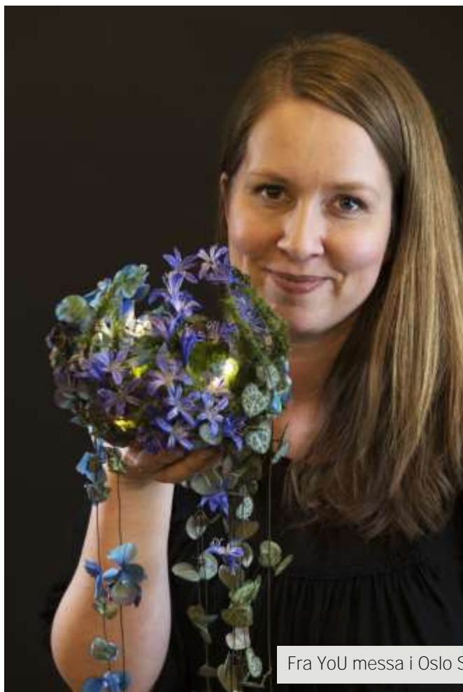
Fra YoU messa i Oslo Spektrum